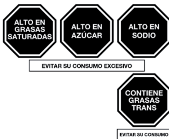
Gráfico 1: Advertencias publicitarias

El contenido de las advertencias publicitarias es el señalado en el Gráfico 1: