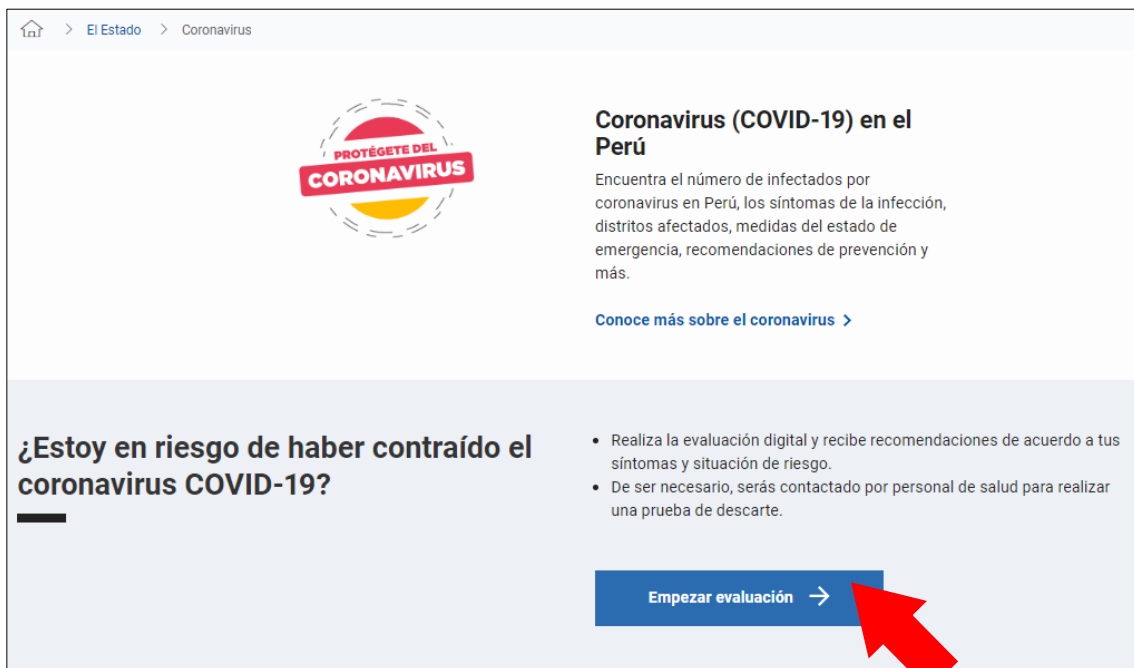
Figura N° 1 – Plataforma Coronavirus

2.1. Ingresar al test virtual, mediante el siguiente link: https://www.gob.pe/coronavirus